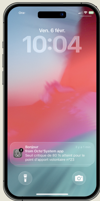
Tableau de bord intelligent